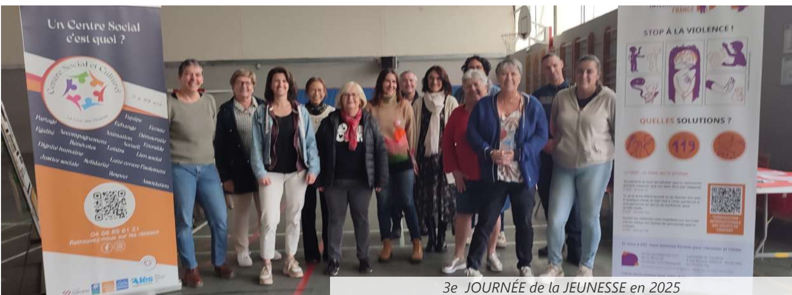
3e JOURNÉE de la JEUNESSE en 2025

N'hésitez pas à venir partager un moment avec eux ! Cette journée est entièrement gratuite.